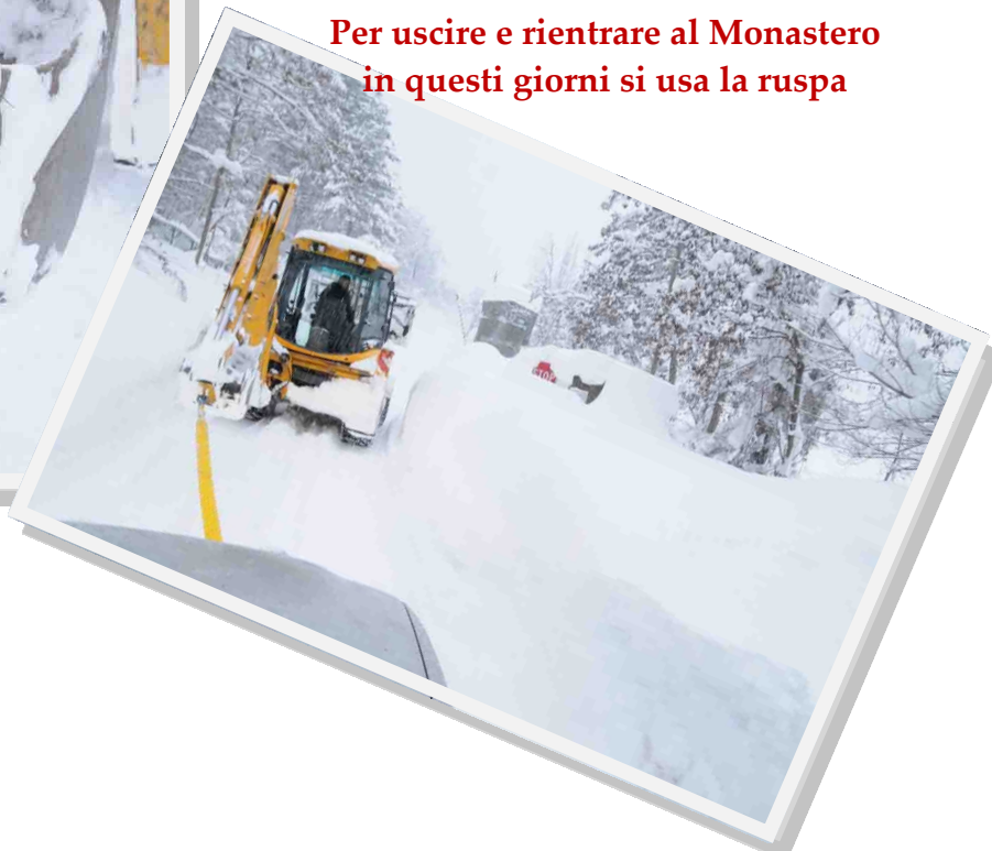
Per uscire e rientrare al Monastero in questi giorni si usa la ruspa