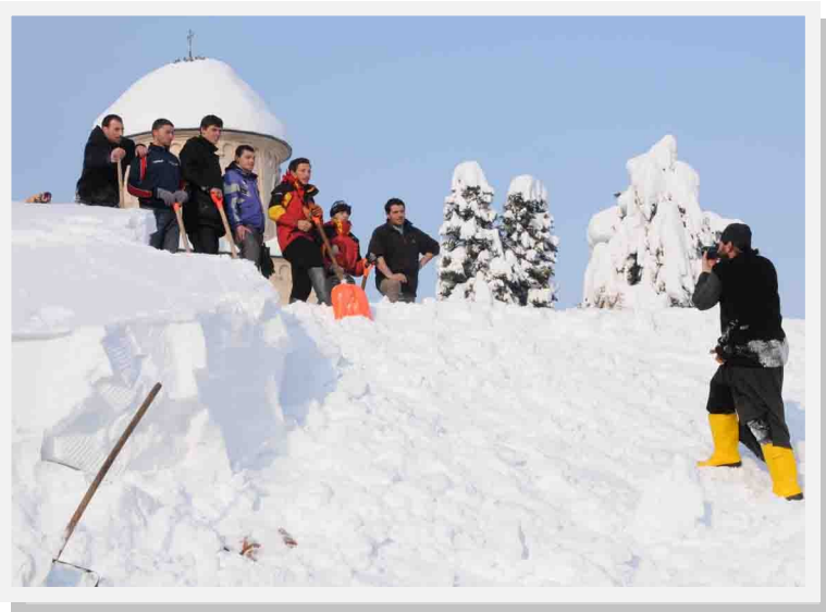
Foto ricordo con i ragazzi di Gorazdevac, sul tetto del Konak